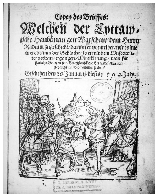
2. Kopie des Briefes, welchen der litauische Hauptmann dem Herrn Radziwill zugeschickt hat. Nürnberg [po 3 II 1564]

wane, jak „Hula”, będąca dialektalną formą toponimu 47 . Nadmienimy jeszcze, że nieco dalej Kochanowski wiernie tłumaczy wyrażenia greckiego pierwowzoru, przede wszystkim okrzyk „bierzcie mnie żywym” (Fr. III 51: „żywo poimajcie”) 48 i określenie „trojańscy bohaterowie” (w w. 6 pojawia się substytucja polegająca na zamianie epitetu „trojańscy” na „moskiewscy”).